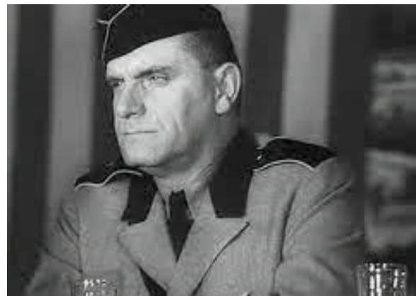
Fritz Julius Kuhn

6 жовтня 1958 року Джордж Лінкольн Роквелл вперше після закінчення Другої світової війни підняв прапор зі свастикою. У своїй автобіографії "Цього разу світ" колишній командувач ВМС США чітко зазначає, що вважає цей день офіційним початком американського націонал-соціалізму в постгітлерівську епоху. Хоча командер Роквелл, безумовно, був найвідомішим лідером цього руху в Сполучених Штатах, він не був першим. Були й інші, за двадцять, навіть тридцять і більше років до нього. Їхні імена, вчинки і долі були майже повністю затерті катастрофою війни, яка стала між їхньою боротьбою і його боротьбою. Але найбільше з тих довоєнних націонал-соціалістів запам'ятався феномен, який антагоністична преса неточно описала як "Німецько-американський Бунд".